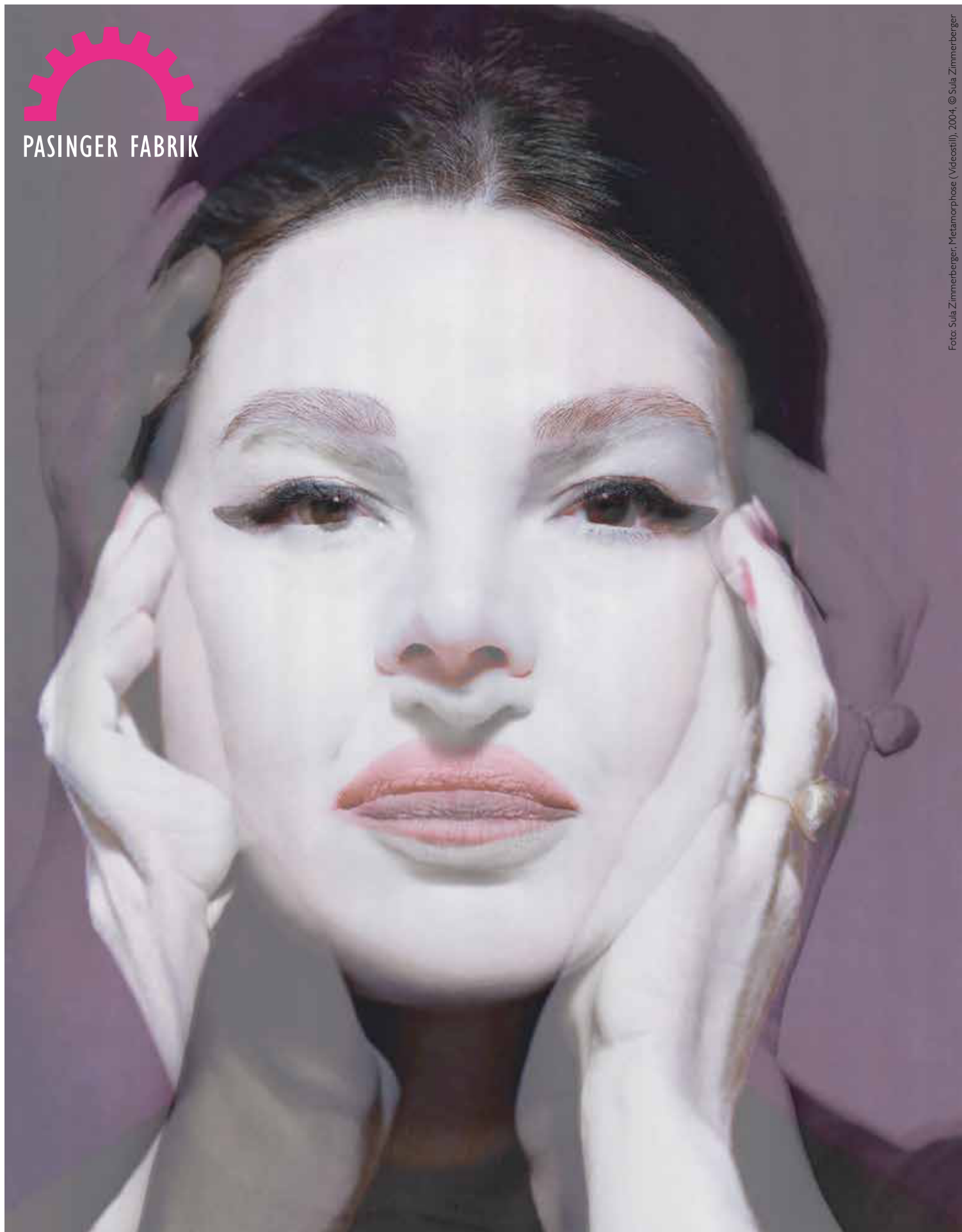
Foto: Sula Zimmerberger, Metamorphose (Videostill), 2004. © Sula Zimmerberger