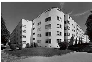
Foto: © Jean Molitor, Augsburg, Lessinghof, Architekt Thomas Wechs, 1931

In Bayern finden sich zahlreiche glanzvolle Bauten der architektonischen Moderne. Überall im Land entstanden in den 1920er und 30er Jahren Wohnsiedlungen,