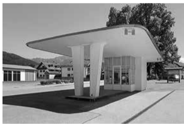
Foto: © Jean Molitor, Benediktbeuern, Tankstelle, Architekt Butz, 1955, Aufnahme 2016